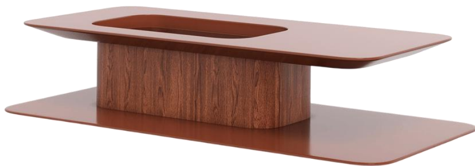
MESA DE CENTRO BALANÇO